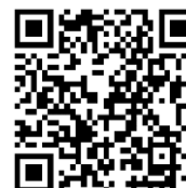
Accès au CAMS

Utilisez ce tableau pour indiquer que la liste de vérification mensuelle a été suivie.