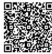
Formulaire de procès-verbal

Les comités doivent se réunir mensuellement et remplir le formulaire de procès-verbal de comité. Les délégués sont aussi invités à utiliser ce formulaire pour présenter leurs conclusions.