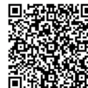
Joindre Sécurité et hygiène du milieu

Code QR : Balayez le code QR pour remplir un formulaire en ligne